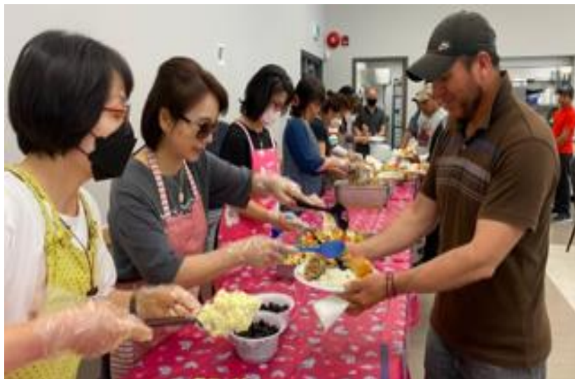
Le dimanche 28 août 2022, la fraternité coréenne Saint-François d'Assise a fourni des repas et des produits aux travailleurs saisonniers de la paroisse Saint-Luc de Maple Ridge, CB