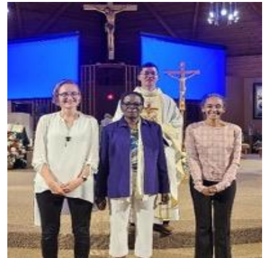
Fraternité St. Berard Engagement à l'Église OLOPH à Sherwood Park, AB le 13 juin, 2022